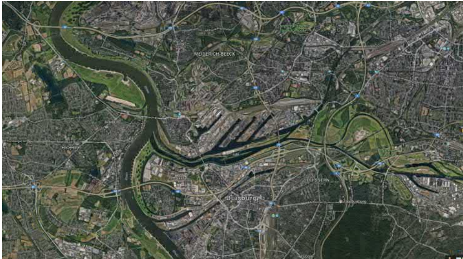
Abbildung 2: Ausschnitt Duisburger Hafen 27