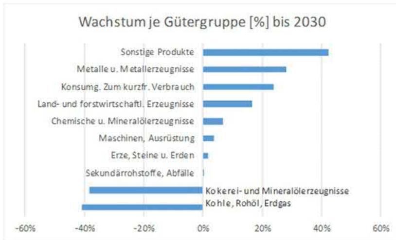
Abbildung 1: Wachstum je Gütergruppe bis 2030 [%]

Der containerisierte Verkehr wird bis 2030 um rund 73 % steigen, was ein Wachstum von rund 1,14 Mio. t bedeutet. Umgerechnet bedeutet dies ein zusätzlich Aufkommen von rund 120.000 Ladeinheiten bzw. 170.000 TEU. Nicht eingerechnet sind hier weitere Potentiale durch Verlagerung. Nach einer groben Abschätzung sind hier mindestens Potentiale in gleicher Höhe möglich. 14