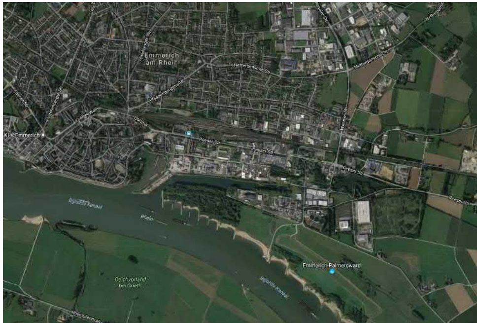
Abbildung 3: Hafen Emmerich 32