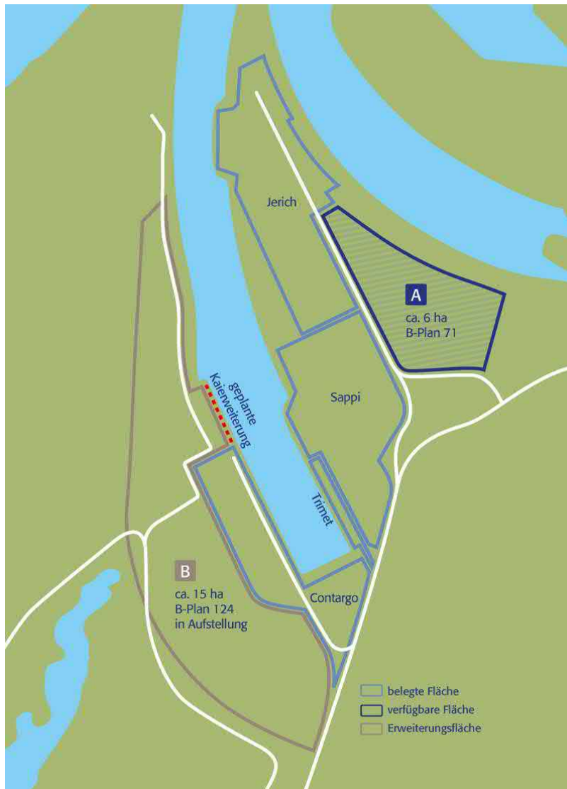
Abbildung 6: Flächenverfügbarkeit Hafen Emmelsum 50

Die Gleisinfrastruktur hat eine Gleislänge von 13 km und ist an das Schienennetz der DB-AG in Oberhausen (Strecke: Spellen – Oberhausen) angeschlossen. Die Gleise erschließen neben dem benachbarten Industriegebiet an der Böskensstraße auch den Industrie- und Gewerbepark in Hünxe-Buchholtwelmen. Als Nachbar des Rhein-Lippe-Hafens, kann der Hafen Emmelsum auf die gleiche Verkehrsanbindung zurückgreifen. Die Strecke von Spellen nach Oberhausen ist teilweise einspurig, nicht elektrifiziert, unbeschränkte Bahnübergänge und manuelle Weichen.