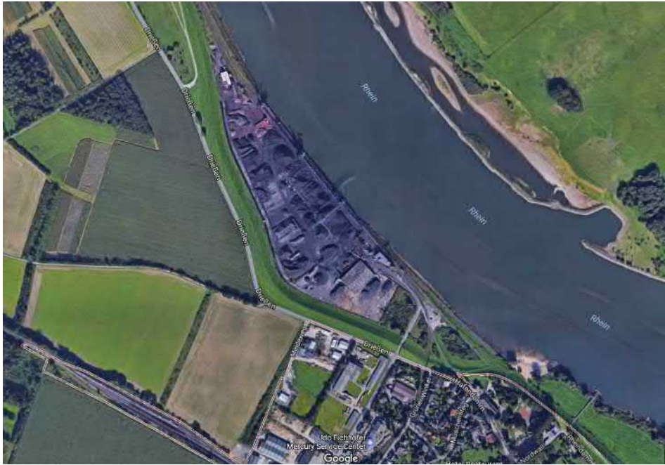
Abbildung 4: Hafen Orsoy 35