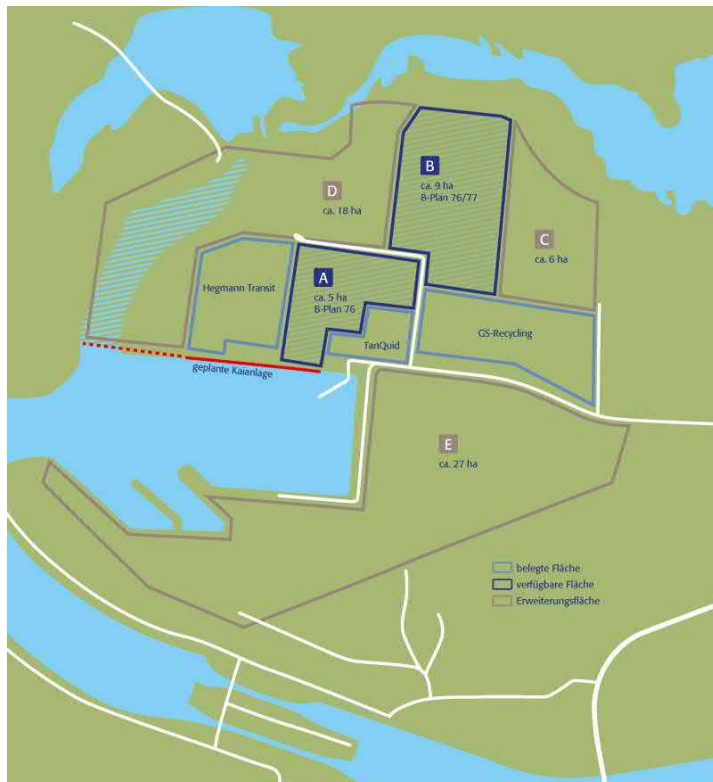
Abbildung 5: Flächenverfügbarkeit Rhein-Lippe-Hafen 44

Derzeit besteht die Suprastruktur aus einer Löschbrücke mit zwei Umschlaganlagen zur Löschung flüssiger Treibstoffe, einer unterirdischen Pipelineverbindung zum Tanklager Hünxe-Bucholtswelmen sowie einer Koppelstelle für Schubleichter. Die aktuelle Uferlänge (Böschungsufer) beträgt 1.650 m. Seit Ende 2015 befindet sich die nördliche Böschung durch die Errichtung einer 350 m langen Kaimauer für zwei Schiffsliegeplätze im Umbau. 45 Die Kaimauer ist von Bedeutung, damit auch Binnenschiffe, die Waren und Rohstoffe zu den ansässigen Firmen transportieren, dort festgemacht werden können. Gleichzeitig steigert diese Weiterentwicklung des Rhein-Lippe-Hafens als Universalhafen die Attraktivität des Standorts für hafenauffine Unternehmen des produzierenden Gewerbes. 46 Profitieren wird davon beispielsweise insbesondere auch die Hegmann Transit GmbH & Co. KG, ein Spezialist für Schwerlasttransporte, der sich erst 2015 mit einer 15.000 qm großen Halle hier angesiedelt hat. 47